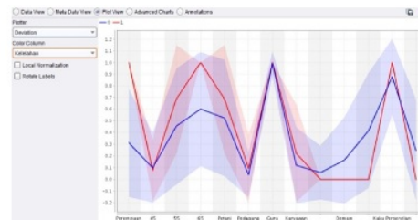
Gambar 13. Tampilan Plot View Nyeri Kelelahan