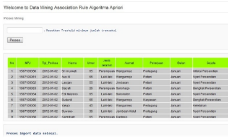
Gambar 5. Input threshold minimum

transaksi yang akan digunakan sebagai batas untuk proses selanjutnya.