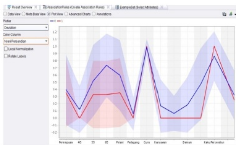
Gambar 12. Tampilan Plot View Nyeri Persendian

Menunjukkan grafik yang mempunyai hubungan antara attribute nyeri sendi biru 1 dan merah 0, jadi mengidentifikasi bahwa semakin tinggi grafik yang ditunjukkan maka atribut itulah yang mempunyai hubungan kuat.