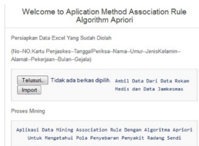
Gambar 4. Import Data

Jika proses import data berhasil dilakukan selanjutnya dapat memasukkan data threshold minimum