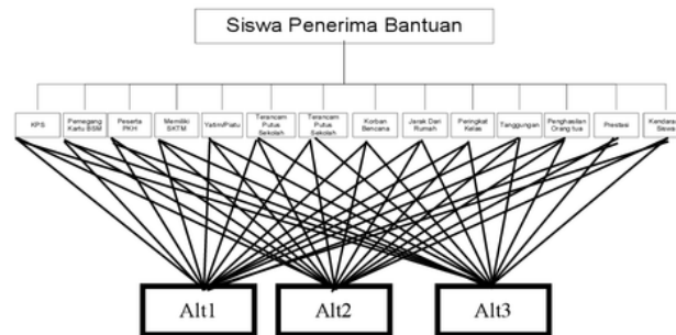
Gambar 3. Hirarki Siswa Penerima Bantuan