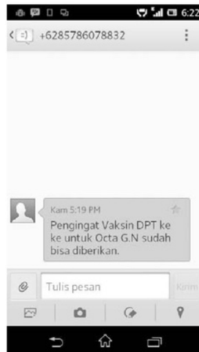
Gambar 3. Pengujian Pengiriman Reminder Imunisasi SMS gateway